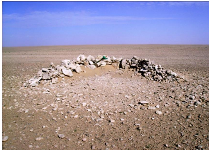
Figure (06) : L'hermitage de Gara-t-l-Gfûl