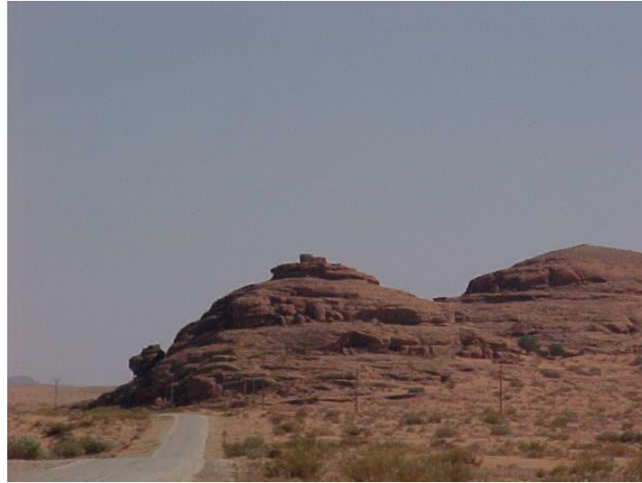
Figure (07) : Thnyyet Ez Zygar