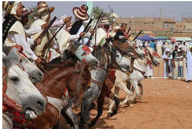
Figure (01) : Le cheval : la monture la plus usitée dans les Monts des Ksour

Étymologiquement, le terme Rakb vient de la racine rakaba c'est-à-dire monter. Il s'agit là, de la monture pour faire le pèlerinage de Stiten vers El Abiodh Sidi Cheikh (Figure 1). Le rite du Rakb a commencé après la mort de Sîd Shaykh (Récits 3). Cette scène a été réduite à une juxtaposition de manifestations profanes festives, qui rendent hommage au Maître de sens Sîd 'Abd-l-Qader B. Mohammed dit "Sîd Shaykh".