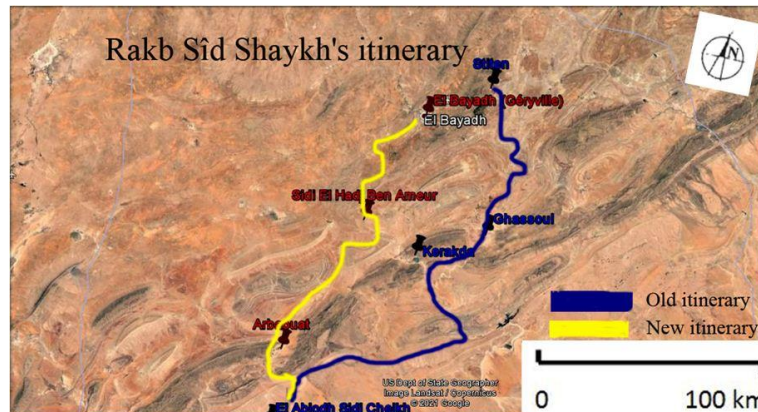
Figure (03) : Les deux itinéraires et les principales stations du Rakb Sîd Shaykh

Le récit (4) est toponymique, il fige un parcours funéraire de Stiten vers El Abiodh Sidi Cheikh. Il définit la progression du cortège funèbre de Sîd Shaykh (Figure 3). Les visiteurs perçoivent et découvrent l'histoire du lieu.