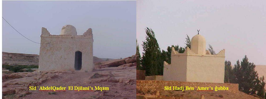
Figure (04) : Photo montage des deux stations du Rakk à Sidi El Hadj Ben Ameer

La caravane s'ébranla et s'étira. Arrivée au ġsar 1 de Sidi El Haj Ben Ameer, le camp fut dressé entre la ġubba du Maître des lieux et celle de Sîd `Abd-l-Qader-l-Djilani (Figure 4). De nombreux pèlerins visitèrent tour à tour les deux sépultures.