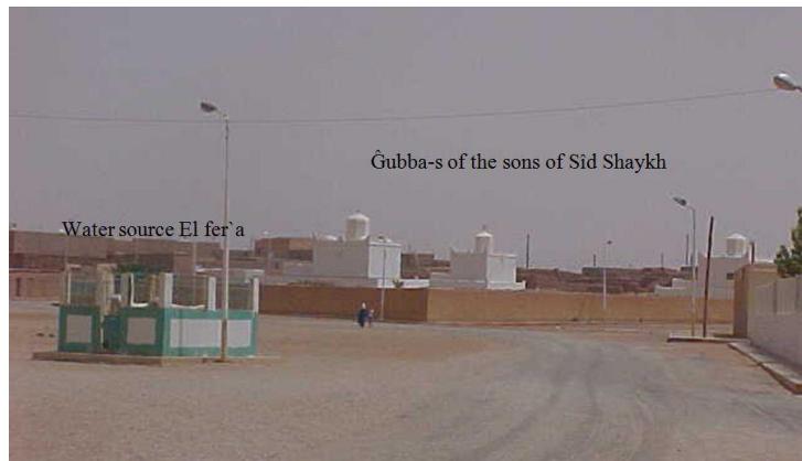
Figure (09) : Ġubba des fils de Sîd Shaykh