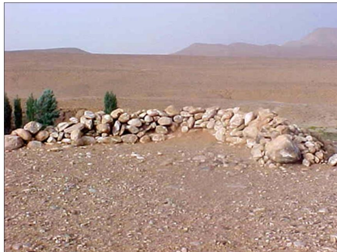
Figure (02): Karkûr Sîd Shaykh, El Bnoud

Sîd Shaykh parcourut les territoires, où on lui attribua plusieurs Karkûr qui lui servirent de khalwa (retraites) (Figure 2). Ces lieux de retraite furent repérés et repérables. Ils balisèrent un territoire. En plus de simples signes d'occupation, ils furent les bornes de l'emprise spatiale du sacré. Ces édifices ( Karkûr ) captèrent, transformèrent un territoire impersonnel en un lieu propre chargé de sens et approprié aux usages du groupe. Par la suite, la descendance du maître eut vivifié les sites encodés par leur aïeul. Ces ermitages ne sont pas implantés aléatoirement, Ils commandèrent les accès des grands Wād qui descendirent vers le Grand Erg Occidental, depuis Wād En Namus, jusqu'à Wād Saḡḡār. Chaque Khalwa fut l'objet de pèlerinages individuels ou de groupes de nomades migrants d'Est en Ouest ou de transhumants du nord vers le sud.