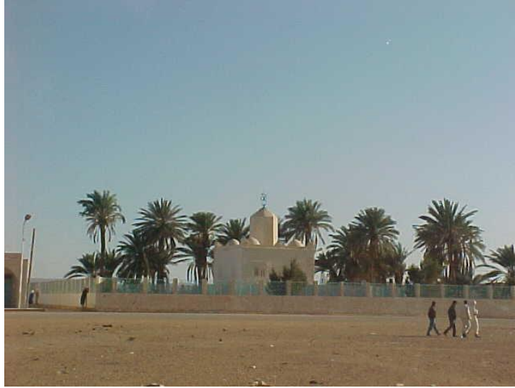
Figure (08) : Ġubba de Sîd Shaykh

"Marabouts et Khouans" (Rinn, 1884) attribuèrent à Sîd Shaykh B Ddin, arrière-petit-fils de Sîd Shaykh par Sîd Hadj Bahûş la construction et la reconstruction de la quasi-totalité des ġubba-s de ses aïeux.