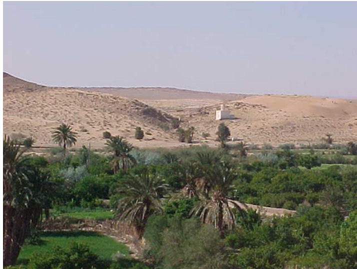
Figure (05) : Wād El Gulayta et la ġubba de Sîd M'ammār Bel 'Alyā, Arbaouat Source : Auteur, Mars 2019

A Wād Ez Zerzur , la caravane s'installa pour passer la dernière nuit. Après quelques instants de repos, le thé et le dîner toujours frugal, les hommes se réunirent en groupes d'une dizaine de personnes, commencèrent les hymnes au Prophète, les psalmodies, Et Tejlil (la glorification de Dieu et de ses serviteurs) (Fortier, 2003). Vendredi, la caravane fut au col de Thnyyet Ez Zyyar (Figure 07). Les cavaliers se regroupèrent. À un signal, tous tirèrent ensemble une salve de coups de fusil. A Thnyyet Ez Zyyar, les pèlerins s'arrêtèrent au mqām de Sîd Skayman Bû-smaha, le grand père de Sîd Shaykh, ils récitèrent la Fatiha et continuèrent leur chemin. Du col, El Abiodh Sidi Cheikh apparaît posé dans une très légère dépression. Les ġubba-s avec leur blancheur, dominèrent le paysage.