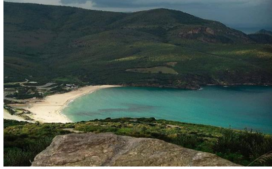
Figure (07) : Plage Djnen El Bey.

Selon la tradition populaire, durant la période ottomane, cette plage était la plus appréciée de l'Est algérien par le Bey de Constantine qui venait y passer chaque année ses vacances d'été d'où le nom Djnen El Bey. 14