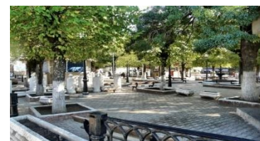
Placette de Séraïdi