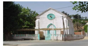
Mosquée de l'Edough