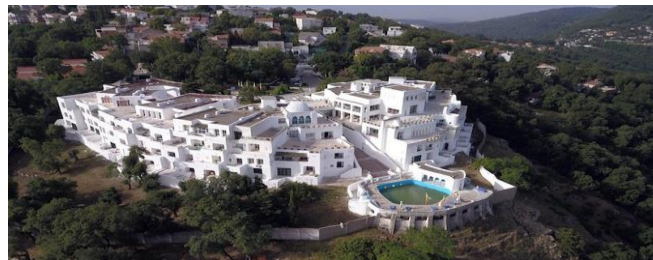
Figure (11) : Vue aérienne de l'hotel El Mountazah

Le lieu incontournable du village de Séraïdi est sans conteste l'Hôtel El Mountazah. Durant l'époque coloniale, l'établissement était un Hôtel-Casino, surnommé "Hôtel du Rocher". En 1967, il fut entièrement transformé en un Hôtel de trois étoiles conçu par le célèbre architecte Français, Fernand Pouillon , il lui donna cet air Andalous et y construisit une piscine pour attirer les touristes. L'hôtel est bâti en nid d'aigle (figre 37) et offre une vue spectaculaire sur la côte nord-ouest depuis la pointe du Cap de Garde jusqu'aux côtes d'Ain Barbar. 12