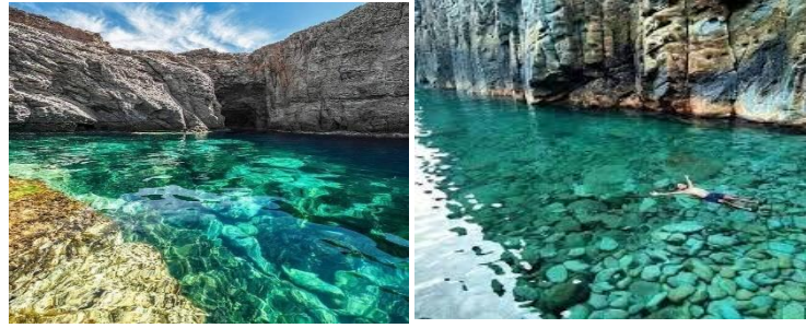
Figure (09) : Plage El Louh.