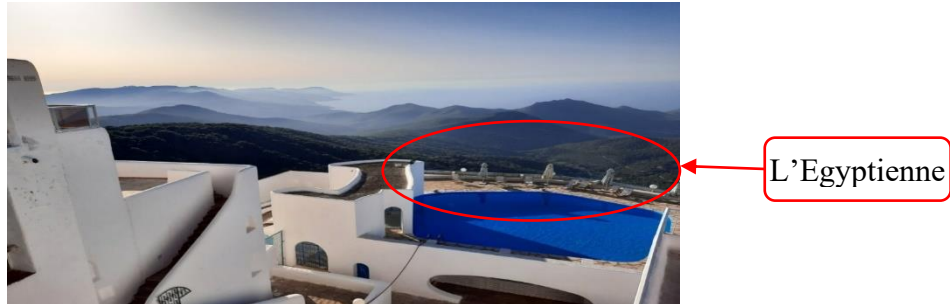
Figure (12) : Vue de la terrasse de l'hôtel El Mountazah.

Les visiteurs de cet hôtel admirent en particulier la vue de la terrasse qui donne sur le massif de l'Edough et la vue de "la femme Egyptienne" ; les montagnes formes entres elles une silhouette qui ressemble aux silhouettes des momies de l'Egypte .