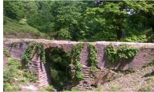
Figure (02) : Photo de l'Aqueduc romain

Bouzizi, Sainte-Croix-de l'Edough, et Ain Barbar faisaient alors partie prenante de la commune de Bugeaud.