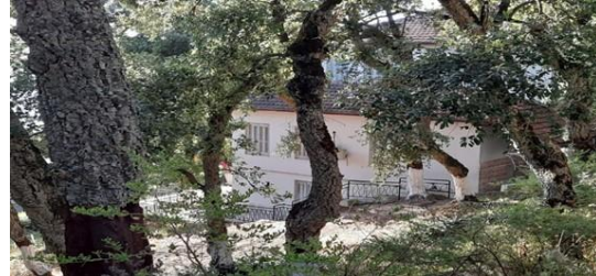
Figure (10) : Maison de jeunes Séraïdi.

Ex-centre de vacances de Sider au niveau de Séraïdi a été transformé en un camp de jeunes qui peut accueillir jusqu'à 100 jeunes.