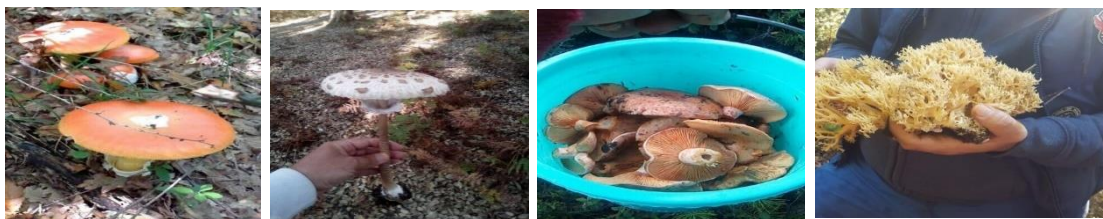
Amanites des Césars

Parmi ces champignons on trouve les Amanites des Césars, les cèpes, les giroles, les coulemelles, les lactaires délicieux et les choux fleurs. Tous ces champignons sont comestibles 13 . Ils poussent abondamment chaque année, les habitants ont l'habitude de les cueillir et de les cuisiner.