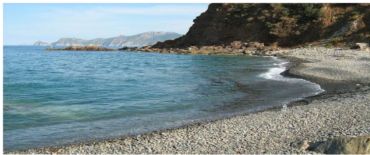
Figure (08) : Plage d'Ain Barbar.

Anciennement une ville minière, le petit village d'Ain Barbar dispose des plus belles plages du littoral. Complètement vierges et pures, ces plages sont très convoitées par les touristes étrangers et ceux à la quête du calme.