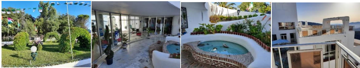
Jardin de l'hôtel

Les clients de l'hôtel El Mountazah sont souvent surpris par ses jardins parfaitement entretenus, son architecture et ses cafétérias dotées de terrasses qui offrent des vues vertigineuses.