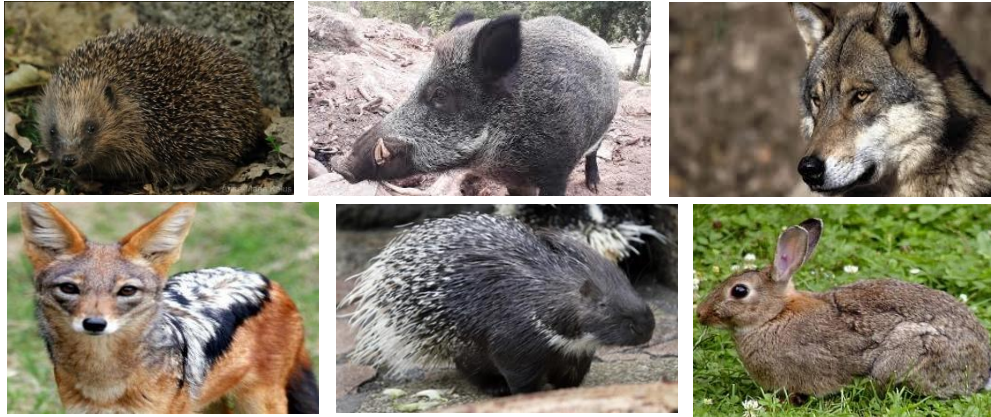
Figure (05) : Les animaux de la forêt de Séraïdi.

De nos jours, les forêts de Séraïdi sont envahies principalement de sangliers, chacals, loups, lapins, porc épic et hérissons.