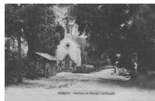
Chapelle Sainte Croix de l'Edough