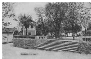
Placette de Bugeaud