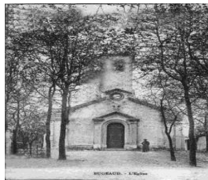
Eglise de Bugeaud