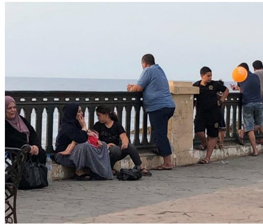
Figure (06) : Echanges, rencontres et balades sur le boulevard Rouibeh Hocine Jijel