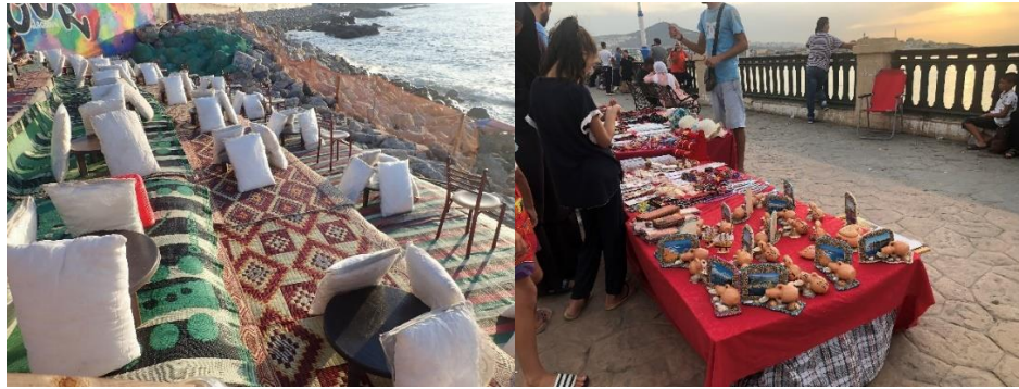
Figure (05) : Pratiques urbaines dans l'espace public de la ville de Jijel entre plaisance et commerce