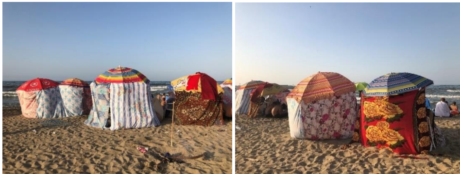
Figure (04) : Appropriation des plages par les allochtones

En plus d'être conservatrice, il semblerait que la ville de Jijel permet aux allochtones à la recherche d'intimité traditionnaliste de s'approprier l'espace public suivant leurs usages et habitudes exogènes (Fig. 4) jusqu'à devenir normes conventionnelles et habitudes perpétuelles : « On leur demande de ne laisser que les parasols et d'enlever les draps mais ils refusent. C'est comme ça ils veulent la HORMA » Yacine (maitre-nageur).