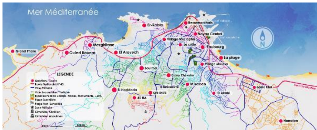
Figure (01) : Les espaces publics de la ville de Jijel ACL

La ville de Jijel (ACL) dans ses limites urbanisables s'étale le long de la méditerranée offrant une continuité entre la terre et la mer : avec des paysages urbains nichés entre des paysages naturels et une topographie hissant les espaces publics sur le balcon de la côte. Telle est la carte postale qu'offrent la ville de Jijel et ses espaces publics objet d'étude.