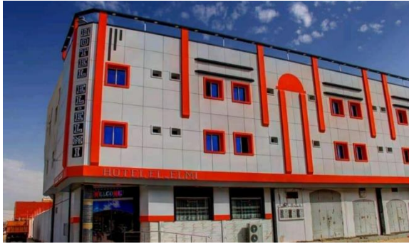
صورة (04): فندق العلمي

أما بخصوص الوكالات السياحية والأسفار فتوجد 21 وكالة سياحية بمدينة وادي سوف تقوم ببيع منتوجات سياحية متنوعة وتقوم بجولات سياحية للسياح الأجانب ومن داخل الوطن، حجز الإقامات بيع تذاكر النقل وتقديم الخدمات لتسهيل راحة السائح ونشاطها مستمر طول السنة ماعدا فصل الصيف بسبب شدة الحرارة.