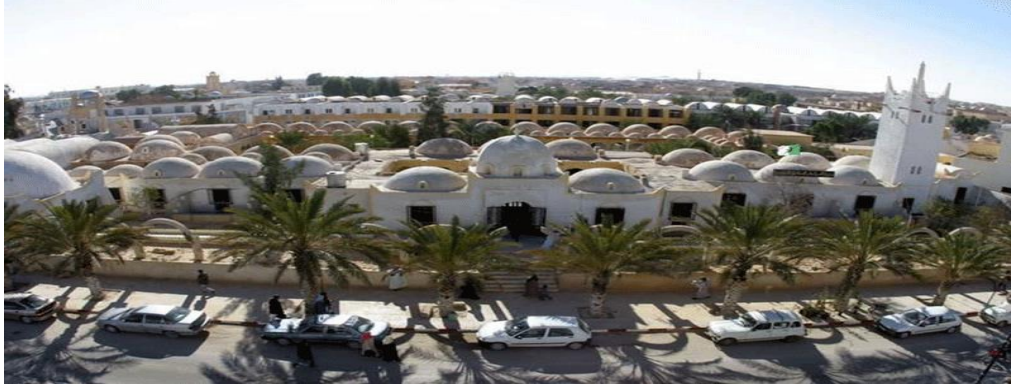
صورة (01): مدينة الألف قبة