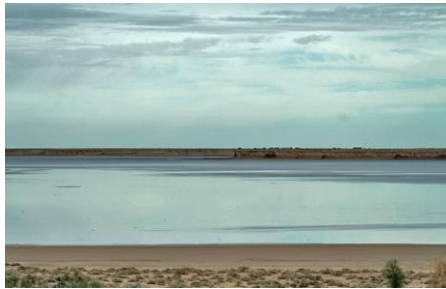
صورة (03): شط ملغيغ

* - الشطوط: ونذكر منها شط ملغيغ الذي ينخفض 30 م على مستوى سطح البحر وهو يعد موقعا طبيعيا هاما مرتبط بتاريخ الملح في الصحراء.