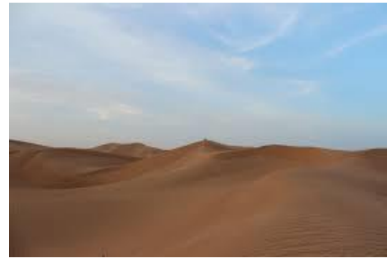
صورة (02): العرق الشرقي الكبير