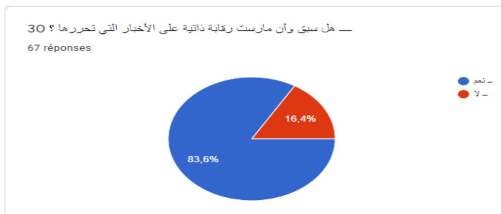
Graphique 3 : les journalistes qui ont déjà pratiqué l'autocensure