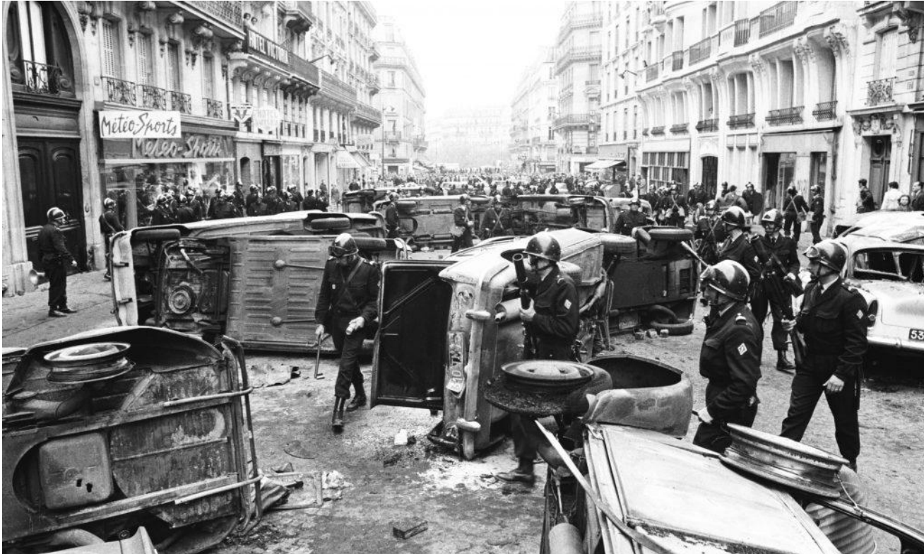
Paris, mai 1968

Aujourd'hui encore, l'héritage de Mai 68 fait l'objet de débats en France. Certains (plutôt à gauche) en gardent une nostalgie positive, y voyant l'émancipation, la créativité, la justice sociale. D'autres (plutôt conservateurs) critiquent Mai 68, estimant qu'il a engendré un excès d'individualisme, la perte du respect de l'autorité, ou une société trop permissive. Quoi qu'il en soit, pour comprendre la culture française contemporaine, il est utile de connaître cet épisode car il explique en partie l'évolution des valeurs entre la génération de nos grands-parents (nés avant-guerre) et celle d'aujourd'hui.